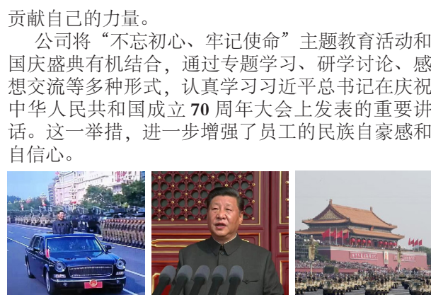
贡献自己的力量。 公司将“不忘初心、牢记使命”主题教育活动和国庆盛典有机结合，通过专题学习、研学讨论、感想交流等多种形式，认真学习习近平总书记在庆祝中华人民共和国成立70周年大会上发表的重要讲话。这一举措，进一步增强了员工的民族自豪感和自信心。

公司员工通过微信工作群聊，分享到整齐划一、精神抖擞的队列方阵，看到各种尖端武器逐一亮相时，不时表达各自内心的喜悦之情。大家一致认为，祖国的发展壮大，是一代一代人努力奋斗的结果，身在新时代，应当更加努力工作，为国家、为企业